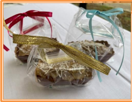
クイーン・エリザバスケーキ 焼き！ 今年は食生活健康学科の 4年生がお手伝いしてくれ ました