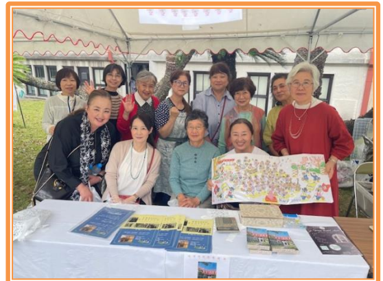
活水同窓会本部役員の方々と事務員